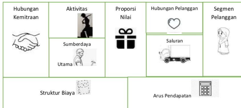
Gambar 1. Bussines Model Canvas (BMC)